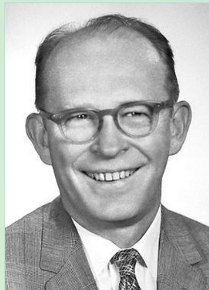
威拉得·弗兰克·利比 Willard Frank Libby 1908.12.17—1980.9.8, 美国化学家。