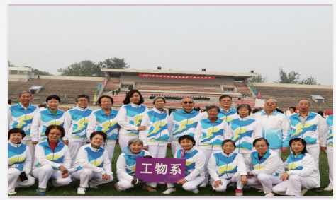
退休教职工趣味运动会