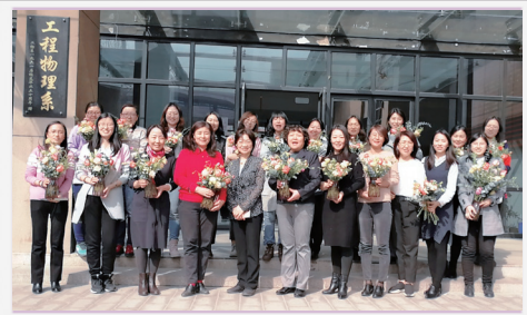
三八节女教工插花活动