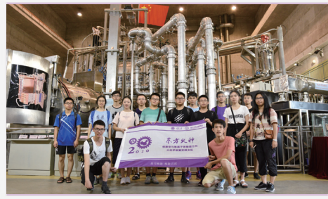
“核能兴邦 2020”东方火种支队在 EAST 合影