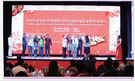
核电国际硕士项目年终交流会暨新年联欢会