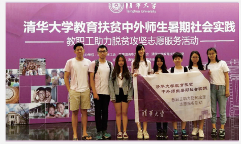
师生暑期实践活动