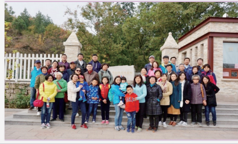
工会会员健步走活动合影